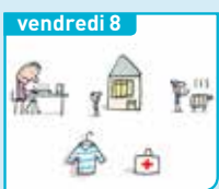
vendredi 8 C'est quoi, une pénurie ?