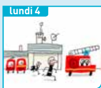
lundi 4 C'est quoi, le métier de pompier ?

Les vidéos de la semaine sur www.1jour1actu.com