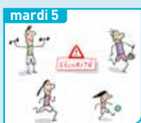
mardi 5 Comment protéger la santé des sportifs ?