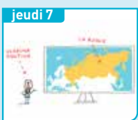
jeudi 7 C'est qui, Poutine ?