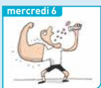
mercredi 6 Pourquoi le dopage est-il interdit par la loi ?